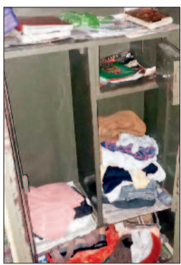
चोरी कर फरार हो गया। प्रारंभिक अंदेशा है कि चोर किसी बड़े